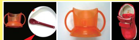
圖四：日常用品採用單一顏色（特別是紅、黃）