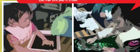
圖一：盤子上加上黑色的底板，突出主題，減少複雜視覺刺激。

通過有系統的訓練，利用視覺教材並經調適的日常用具及環境，孩子一般能有不同程度的改善。例如：