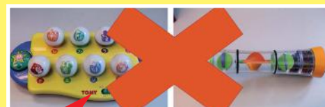
圖二：避免採用多顏色玩具和操弄的時候同時發聲