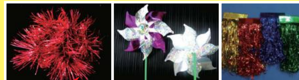
圖六：反光和彈簧等物料，能產生動感，適合採用來做教具